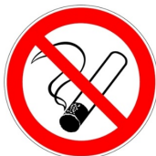
Verboden te roken

Betekenis: Deze borden geven aan wat absoluut niet mag, verboden is.